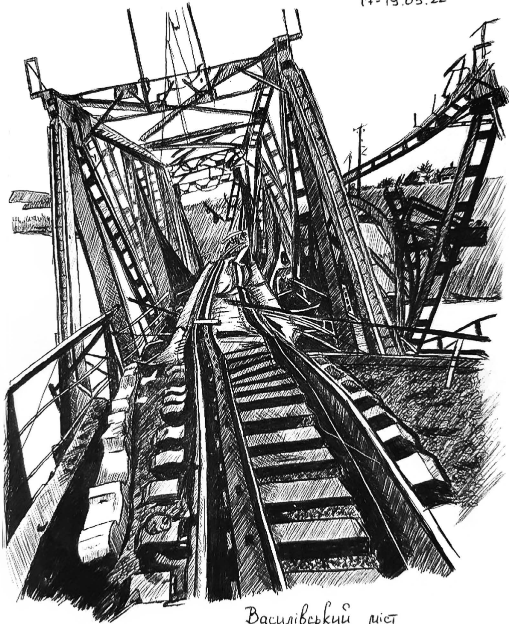
Василівський міст (Запорізька обл.)